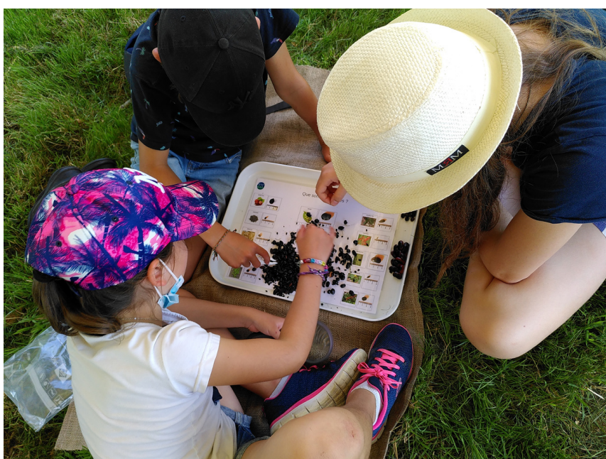
RPB Essé - 21/07/2021

Les Rencontres préhistoriques de Bretagne seront reconduites en 2022, avec déjà plusieurs sites demandeurs, notamment Essé, Langon, Arzon, Plouhinec et Carhaix, preuve de l'engouement pour ces journées de valorisation des sites préhistoriques.