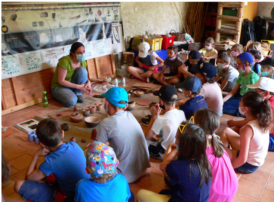
Atelier poterie-10/06/2021-Ecole Beausoleil, Questembert