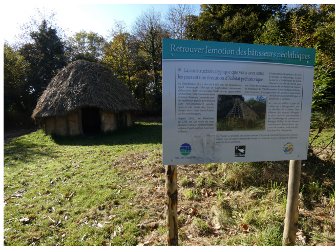
Inauguration maison néolithique - Chapelle-de-Brain - 11/12/2021