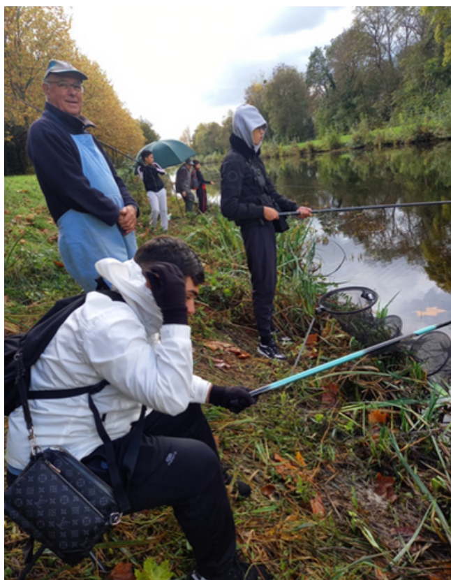
Initiation à la pêche des jeunes du quartier de Bellevue - le 04/11/2021

Le CPIE Val de Vilaine a répondu en 2020 à l'Appel A Projet de la Ville de Redon, dans le cadre de sa politique de la ville, pour permettre aux jeunes du quartier Bellevue de Redon de pouvoir bénéficier d'animations gratuites sur le thème de la nature. Ce projet n'a pas pu commencer en 2020 du fait de la crise sanitaire et s'est donc poursuivi en 2021. Différentes animations ont eu lieu comme une journée d'initiation à la pêche avec l'association de pêche du Pays de Redon. D'autres sorties nature se dérouleront sur l'année 2022 afin de clore ce projet.