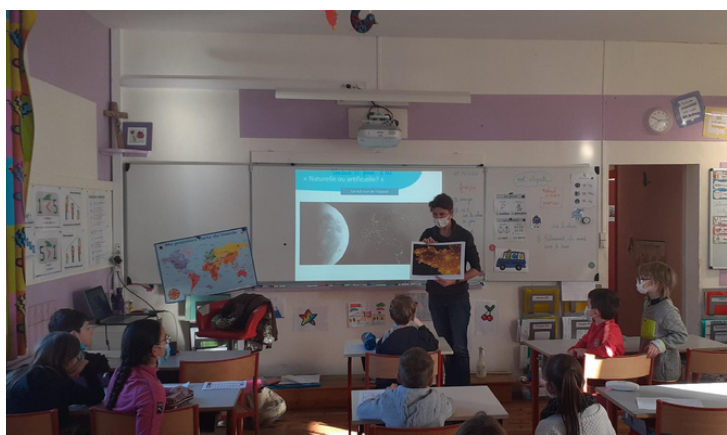
Animation Watty sur le thème des lumières-25/02/21-Ecole St Michel, Pléchatel