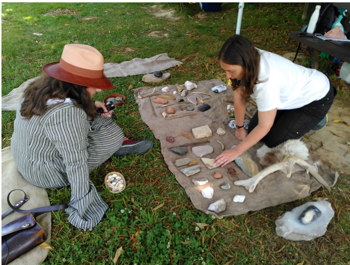
RPB Essé - Atelier "Les Roches utilisées à la Préhistoire" - le 21/07/2021