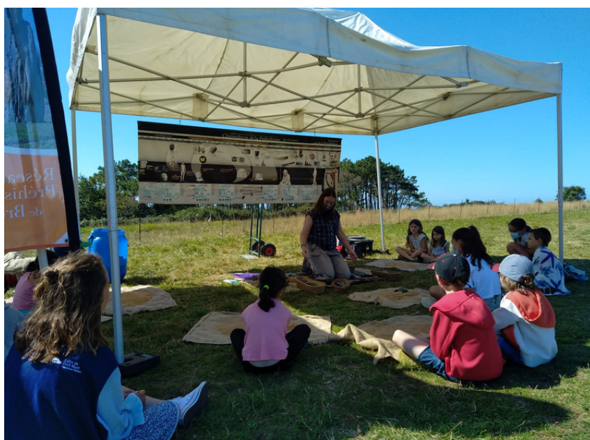
RPB Arzon - 12/08/2021 & 13/08/2021