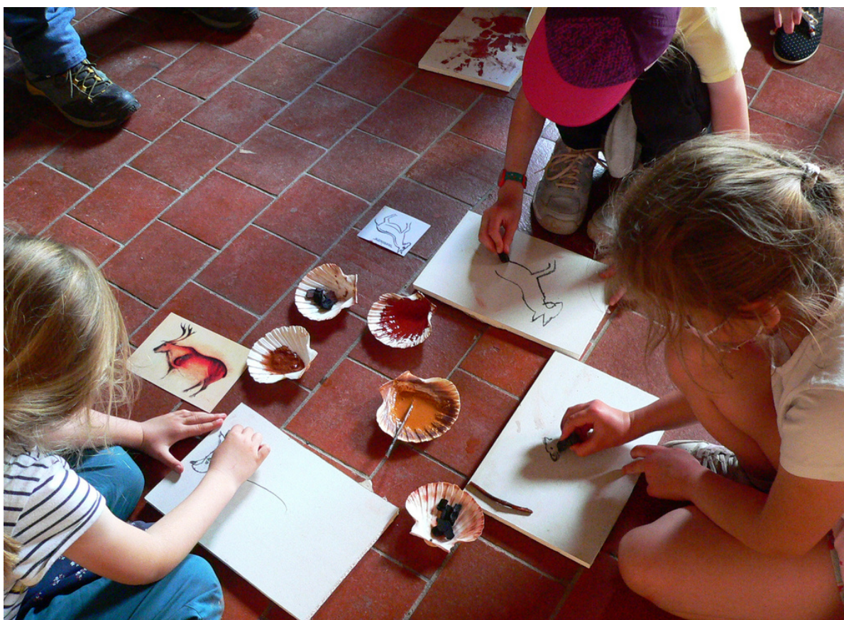
Atelier peinture-10/06/2021-Ecole Beausoleil, Questembert

Notons que les demandes d'intervention dans les établissements ont également augmenté, ce mode d'intervention sera aussi développé en 2022.