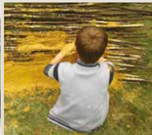
Atelier torchis néolithique