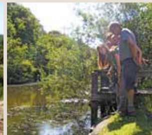
Éducation à l'environnement en milieu aquatique