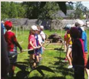
Atelier déplacement de mégalithes