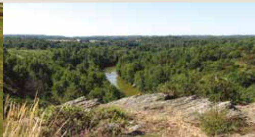
Site des landes de Cojoux à Saint-Just